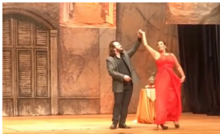
De Mogi Mirim

Em homenagem ao legado do lendário tenor Luciano Pavarotti, que completaria 90 anos em 2025, Mogi Mirim será palco de uma das apresentações da