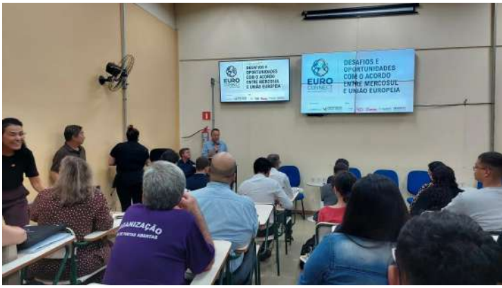
De Mogi Mirim