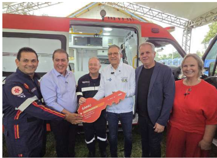
De Mogi Guaçu O Governo Federal entregou no sábado, dia 9 de maio, em Campinas, veículos do programa

Agora Tem Especialistas – Caminhos da Saúde, em uma estratégia para ampliar o acesso da população aos serviços especializados do Sistema Único de Saúde (SUS). Mogi Guaçu está entre os municípios contemplados com uma ambulância do Serviço de Atendimento Médico de Urgência (Samu).