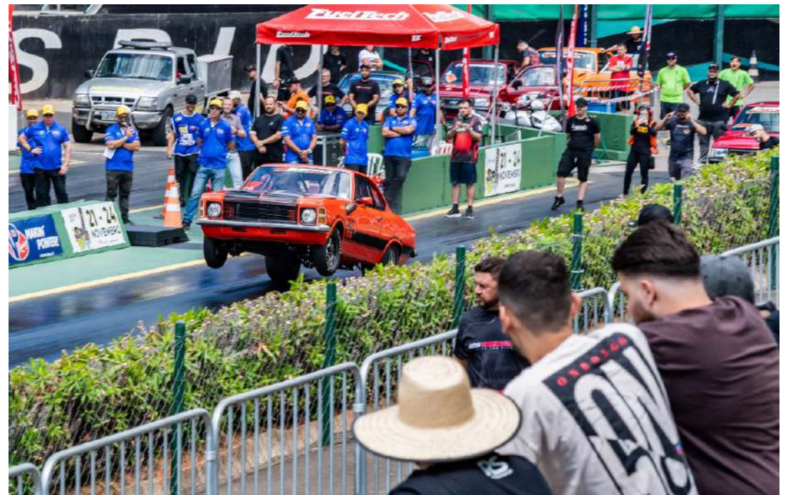
promotora do evento

*consulte as regras para compra de ingressos no site de vendas da