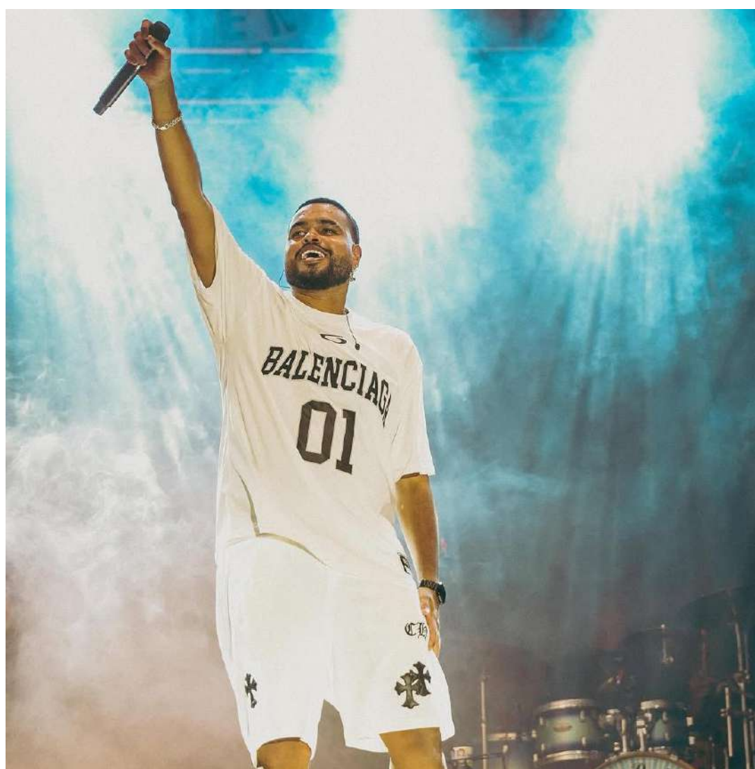
Na quadra da Mocidade de Padre Miguel, a primeira edição do ano reuniu