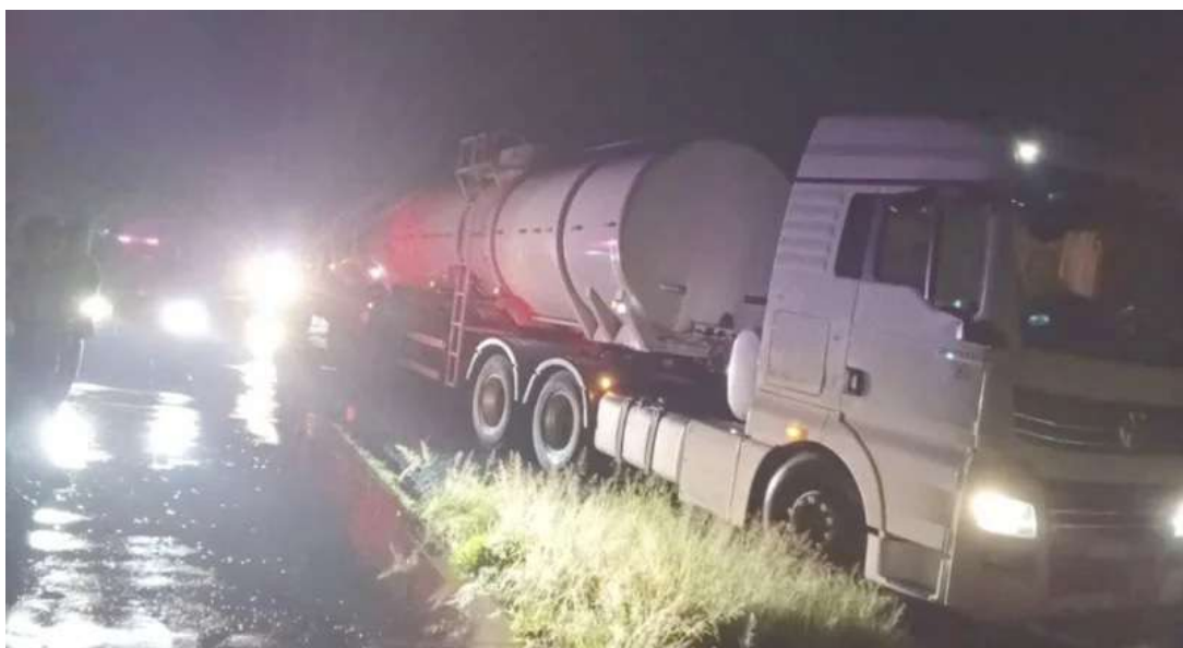
Veículo foi localizado na rodovia SP-133, mas carga de eta-

nol avaliada em cerca de 200 mil reais foi levada pelos criminosos. Um caminhão roubado na noite de segunda-feira, 6 de abril, foi recuperado pela Guarda Municipal de Cosmópolis na terça-feira, 7 de abril, após trabalho de monitoramento e inteligência. De acordo com informações da corporação, o motorista relatou que foi rendido por quatro homens armados enquanto trafegava pela rodovia SP-348, nas proximidades de Santa Bárbara d'Oeste. Segundo o depoimento, o condutor foi levado pelos criminosos e posteriormente abandonado na rodovia SP-332. Após