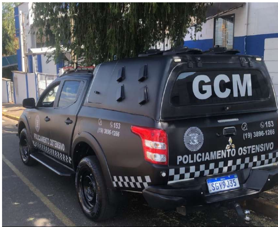
Vítima foi levada ao hospital com suspeita de nova lesão

grave; agressor foi preso em flagrante após ameaçar a mulher na frente da equipe policial