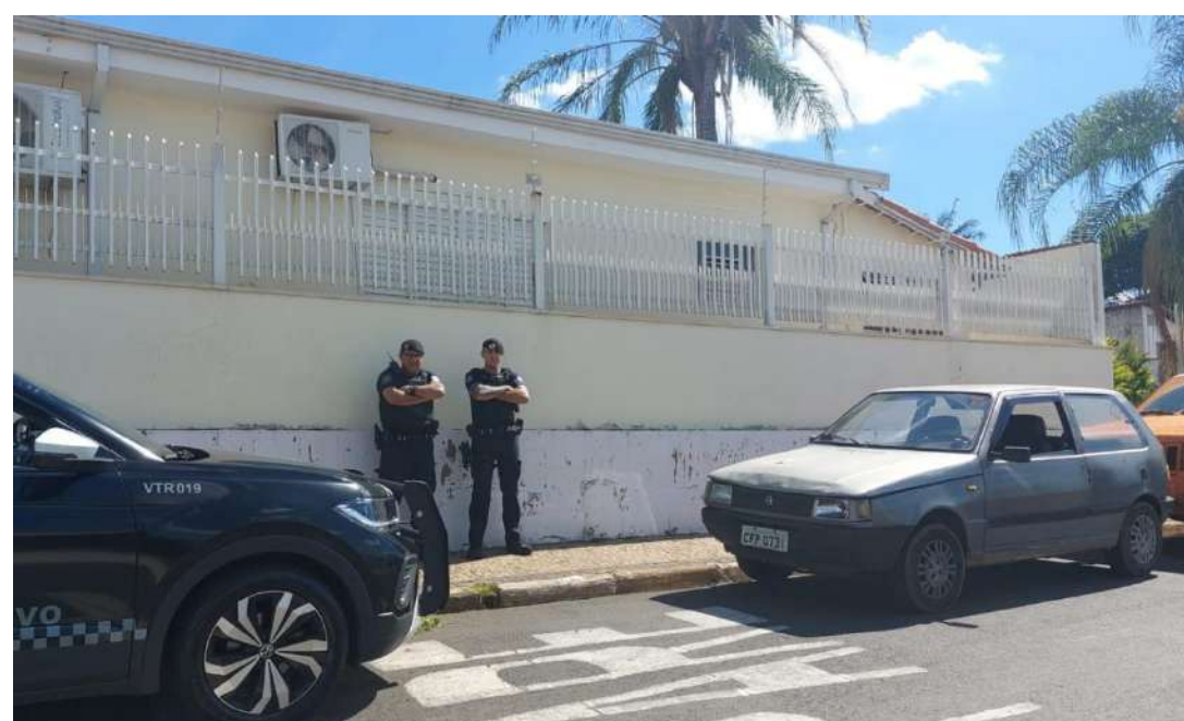
Veículo foi encontrado intacto após o furto; ocorrência foi registrada