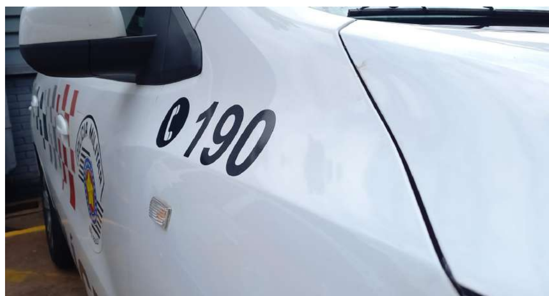
foi apresentada na Central de Polícia Judiciária, onde o ado-

Durante a abordagem, o infrator admitiu que pretendia fugir da cidade e que cometeu o ato por ciúmes. A ocorrência