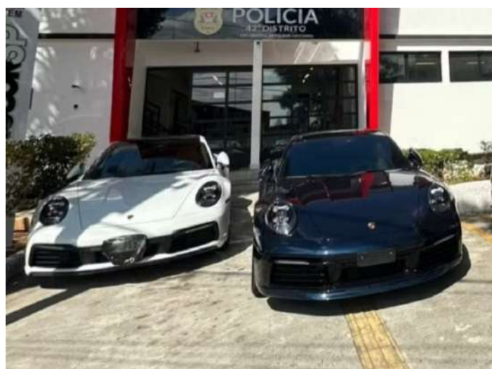
Operação apreendeu carros de luxo, computadores e celulares; es-

quema redirecionava vítimas para site falso com aparência de órgão oficial.