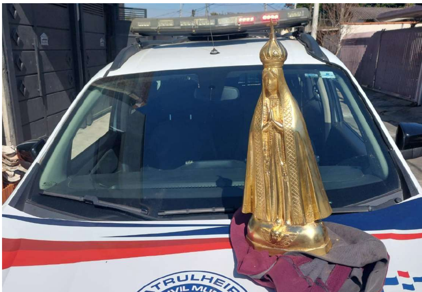
Imagem de Nossa Senhora Aparecida, feita em bronze, foi recuperada e devolvida à família proprietária do túmulo

A Guarda Civil Municipal (GCM) de Amparo prendeu, na sexta-feira (8), um homem acusado de furtar uma estátua de Nossa Senhora Aparecida do Cemitério do Sylvestre. O flagrante foi possível após a administração do local perceber a saída de um indivíduo carregando a imagem em direção ao bairro Jardim Camanducaia.