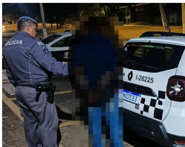
Ocorrências distintas resultaram em pri-

sões por ameaças, agressões e tentativa de levar filha menor.