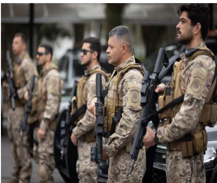
Criminosos invadiam sistemas governa-

mentais e de Justiça para enganar vítimas