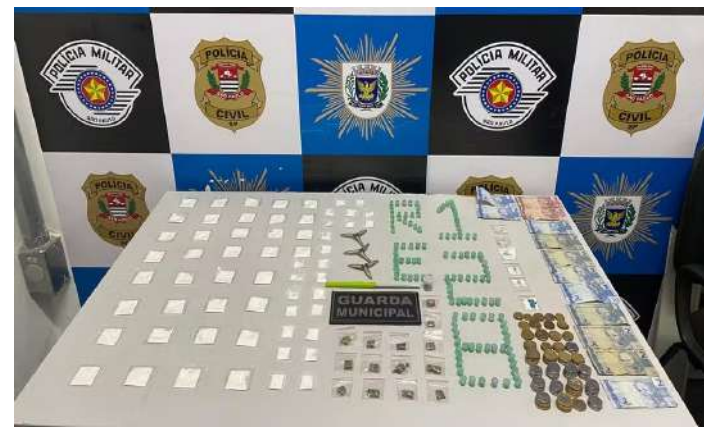
onde permaneceram presos e à disposição da Justiça.

Os dois homens foram levados à delegacia,