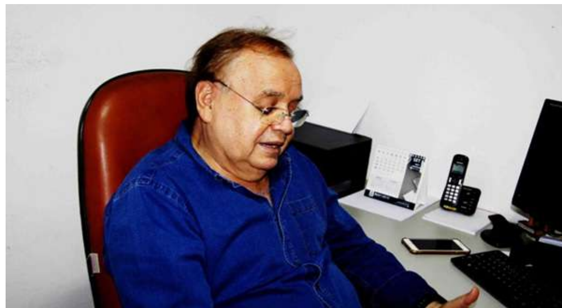
“Eu teria dito para o meu pai: Pai eu te amo!”

“O livro, escrevi para contar e contextualizar a saga do Clube Recreativo São Pedro, com muitos casos de pessoas que por aqui passaram e muita gente não tem ideia, relato momentos históricos e importantes para o nosso município e outros detalhes memoráveis,