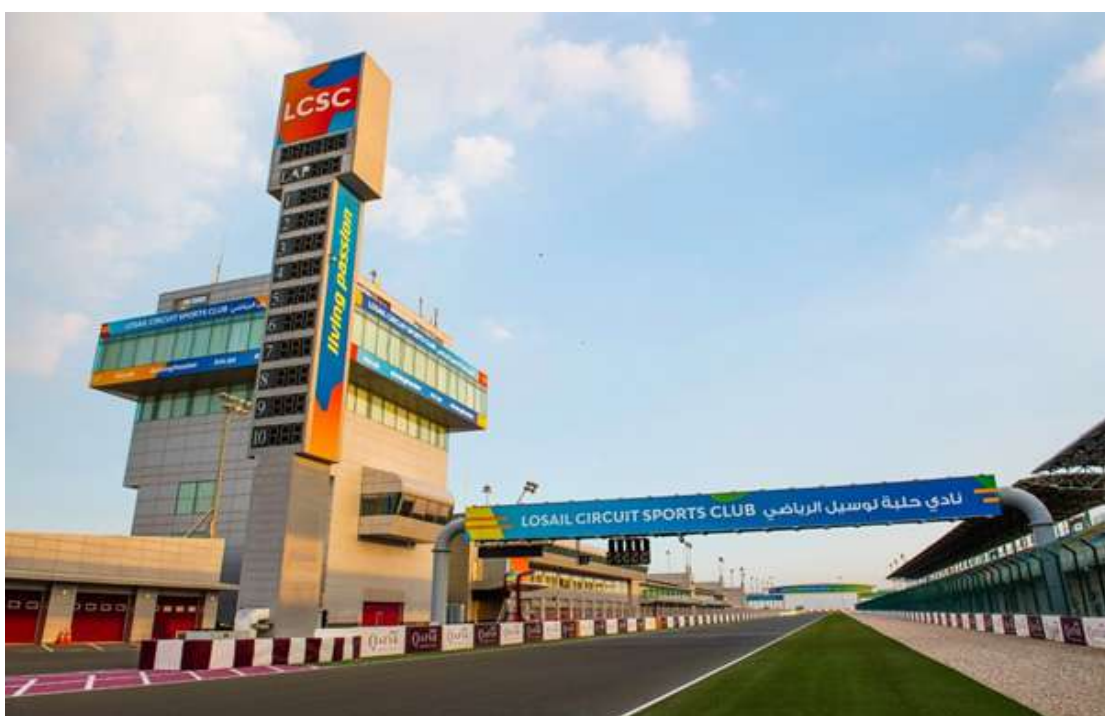
Circuito de Losail, palco da MotoGP no Catar, receberá a Fórmula 1 pela primeira vez em 2021

Anistia Internacional demonstrou preocupação com confirmação de prova em Doha, em 21 de novembro deste ano, e risco de evento silenciar questionamentos sobre violações de direitos humanos